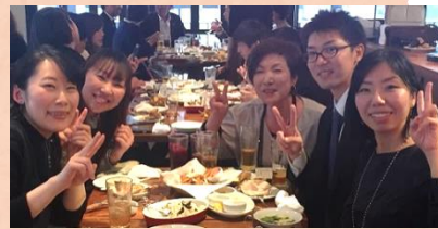
山田社長から一いただき、いよいよ乾杯！